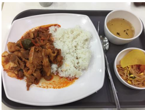
辣炒豬肉蓋飯，台幣 100 元 分量超大，又好吃，是學生間的人氣 菜單。

飲食方面，我們學校的學餐挺好吃的，價格也不貴，一餐大概 100-120 台幣，在韓國已經是相當划算的價格，分量也很大，聽說之前還因為 CP 值很高而上過電視節目。宿舍那棟樓也有便利商店，餓的話搭個電梯到地下一樓就可以買到食物，半夜餓的話，校門口旁的學生會館裡面的便利商店是 24 小時的，隨時都可以去買零食。