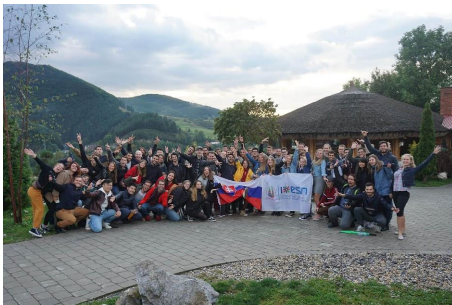
圖 5 Erasmus 活動大合照

歐盟的存在，讓歐洲人的生活圈就不僅僅只侷限於他們出生的國家，而是整個歐洲大陸。換句話說，許多歐洲人從小就能接觸來自四面八方不同國家的人們，與他們交流想法、價值觀，抑或是到處旅遊、增廣見聞，也為自己的人生增添了更多選擇。然而，由於台灣屬於海島型國家，每次出國所要花費的心力、財力相對於歐洲人出國就會困難許多，如果本身家裡之經濟能力不允許，那我真心建議同學們可以好好爭取學海飛颺的獎學金補助。此外，一定要多練習用英文來介紹台灣的一切，並多接觸一些歐洲的文化（如足球、各國文化歷史等），這樣才能幫助你更快融入歐洲的生活。