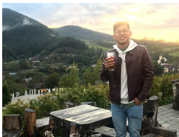
圖 4 來點啤酒吧