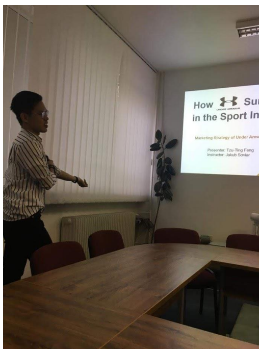
圖 1 行銷課期末報告

在課堂一開始，教授會要求學生選定一個自己喜歡的企業，作為個案討論的案例。在課堂的前半段教授會先與每位學生輪流討論上周的行銷理論於該企業的應用為何，做一個簡單的交流，分享彼此的看法。並在後半段講解新的行銷知識，並於下周進行討論。透過這樣的方式，我感受到的是知識是真正的被活用，在查資料、閱讀、思考不斷循環的過程當中，我可以更理解該企業當初為甚麼要做出這樣的決策、其背後的商業邏輯是什麼，也讓我能夠輕易地記清楚生硬的理論知識，是我個人非常推崇的教學模式。