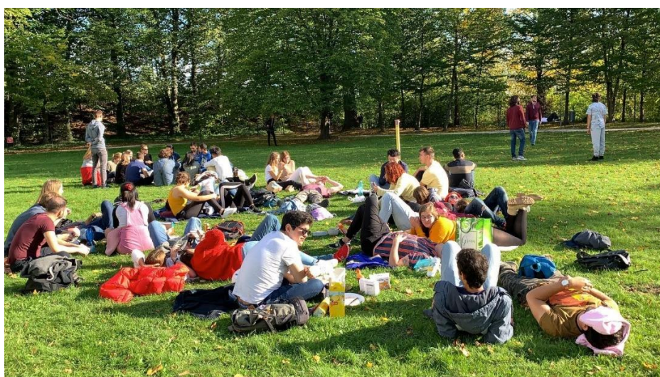
圖 2 Erasmus 活動 (Hiking and Camping)