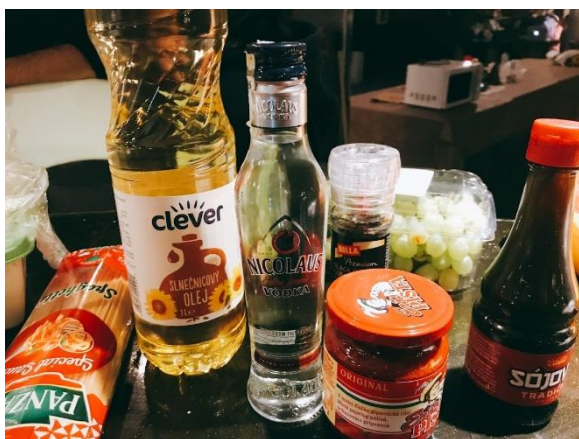
圖 3 煮飯的食材

即便在物價相對便宜的斯洛伐克，外食都不便宜，就連相對便宜 Kebab 一餐也要 5 歐左右。因此，如果待在宿舍的話，我們通常都會在 Common Room 煮飯，大概 2 至 3 歐就可以解決一餐，像是義大利麵、漢堡、三明治等等，而食材的部分（麵條、醬油、油、鹽、糖、肉品等）超市都可取得，且都不大貴。如果你本身會煮飯，其實是一個很好機會可以跟同學們分享各國的美食；但如果你不會煮飯也沒關係，來了就會了（歐洲都很習慣煮飯，因為外食對他們來說也很貴！）。除此之外，歐洲很大部分的 Taped Water 都是可以飲用的（建議先詢問櫃檯），如果不安心可以到鄰近超市買瓶裝水，但除了水之外，啤酒也是個好選擇，因為歐洲的啤酒真的比水還便宜，且歐洲人很愛 Party，一到 Party 就是各種酒都來，所以入境隨俗也是必要的吧。